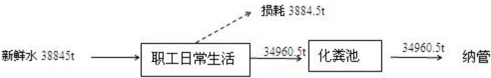
图3-3 水量平衡图 (t/a)