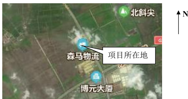
图 3-1 项目地理位置图

森马嘉兴物流仓储基地位于浙江省嘉兴市嘉兴港区新 07 省道 132 号。厂界东侧为新 07 省道路以东为空地（规划工业用地）、圣泰戈有限公司（目前厂房（闲置））；南侧为茂友木材股份有限公司；西侧为河道，河对岸为规划道路，路西面为空地（规划工业用地）；北侧为明君路，路北面为空地（规划工业用地）。本项目地理坐标为 N30°37'37.488" E121°3'12.312"