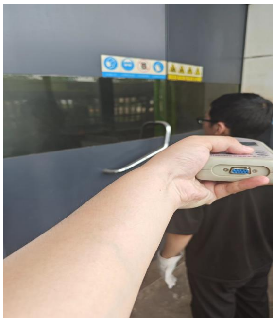
生产车间激光切割岗位