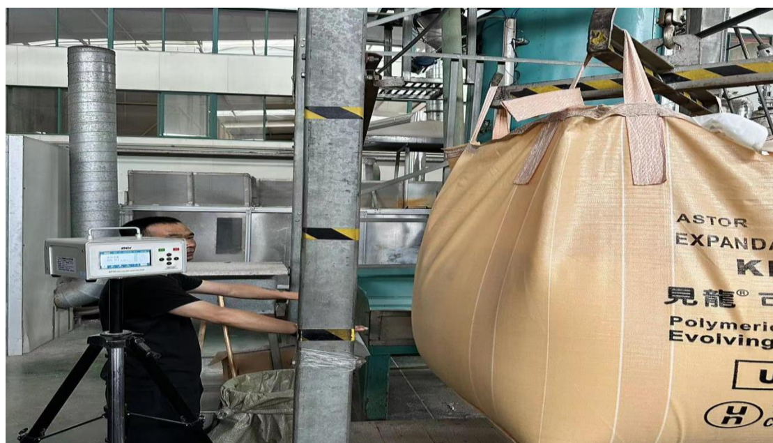
生产车间预发投料岗位