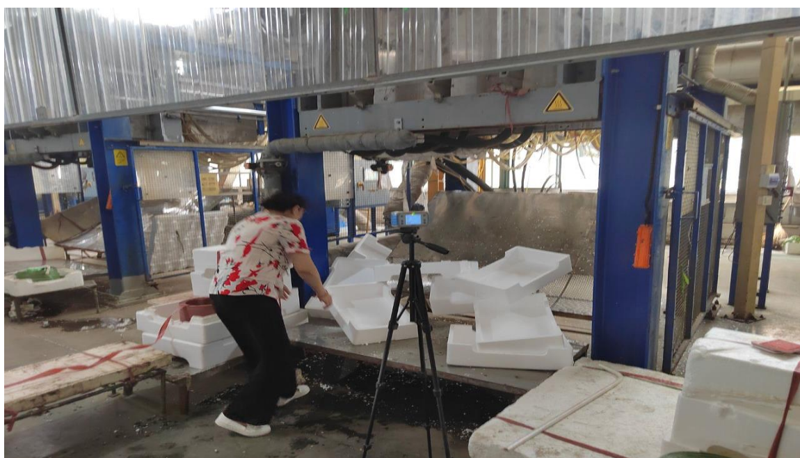
生产车间成型岗位