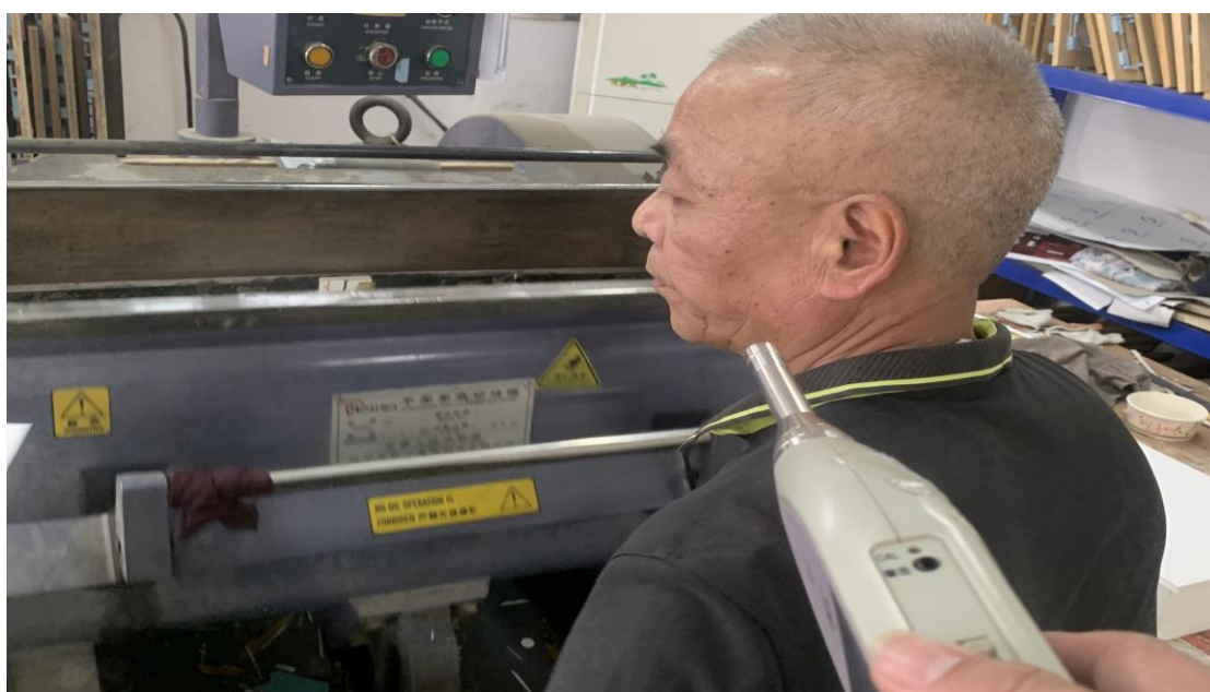
生产车间 1F 覆膜岗位