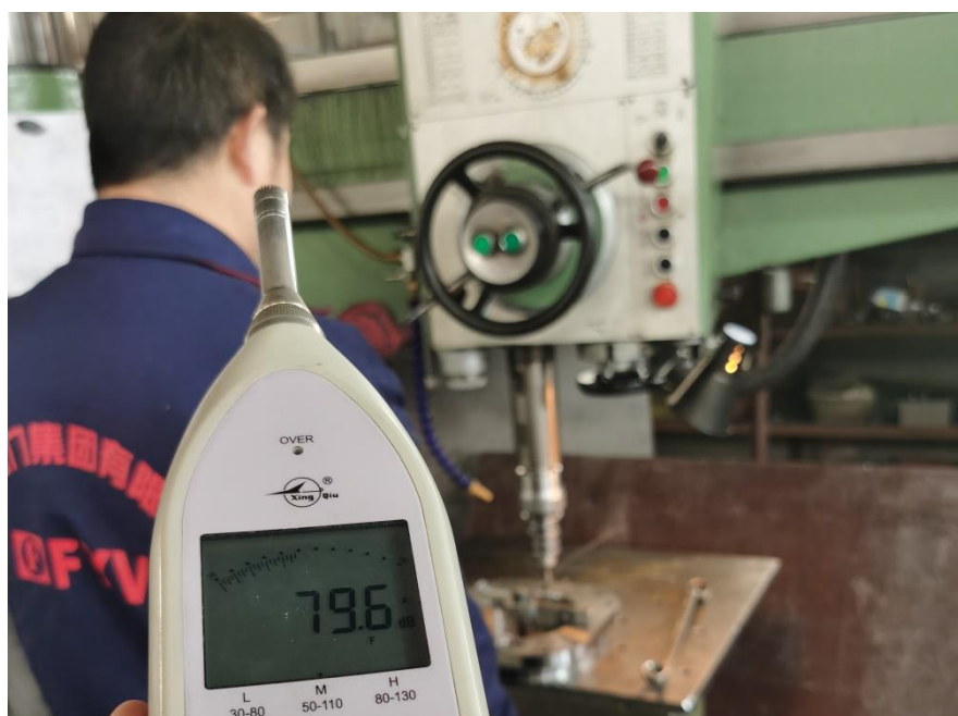
生产车间-钻床岗位