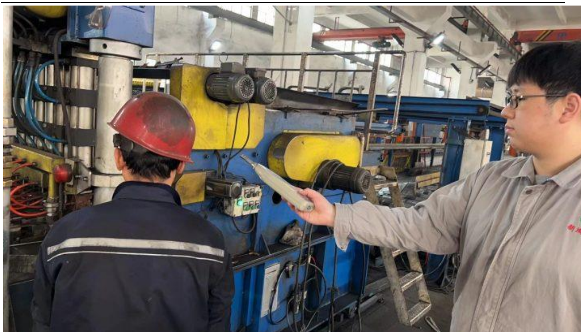
4号车间焊网机岗位