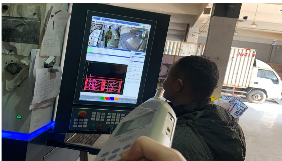
1F 生产车间激光切割岗位