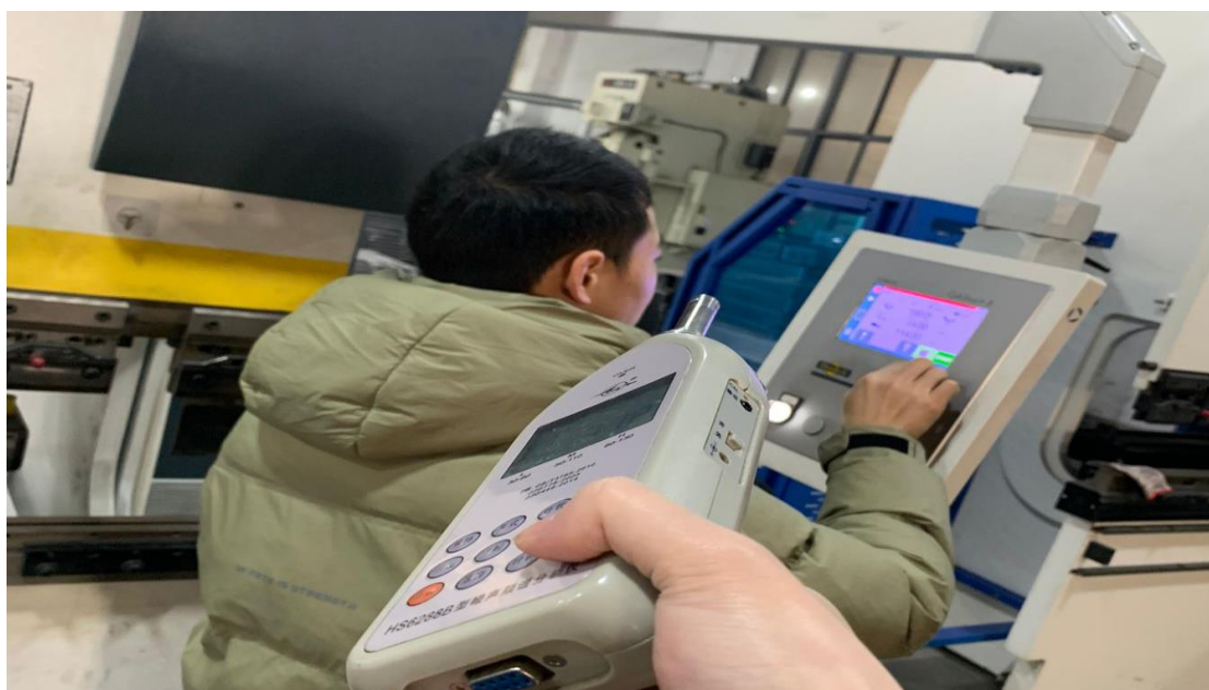
1F 生产车间折弯岗位