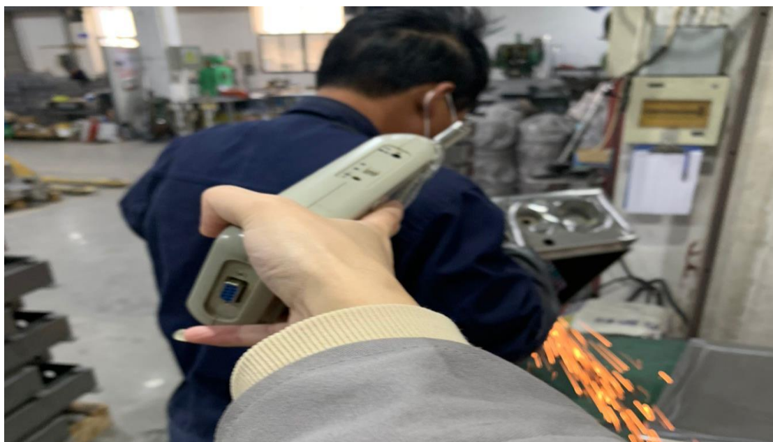
1F 生产车间打磨岗位