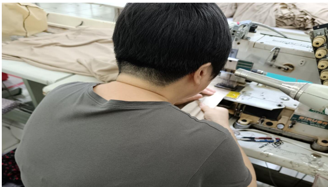
车缝车间缝纫岗位