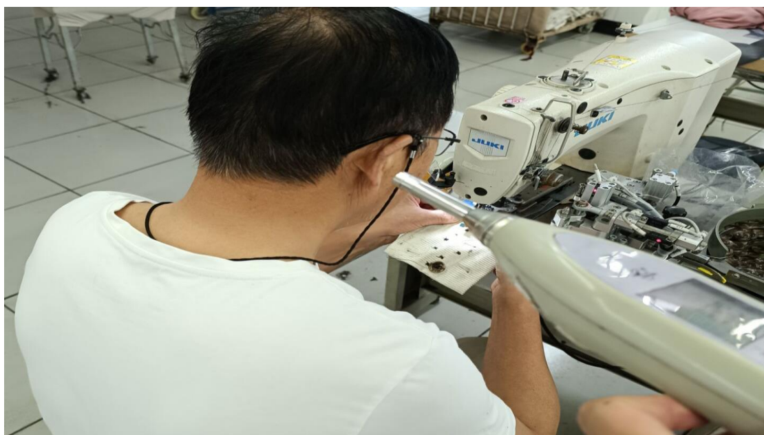
车缝车间锁扣岗位