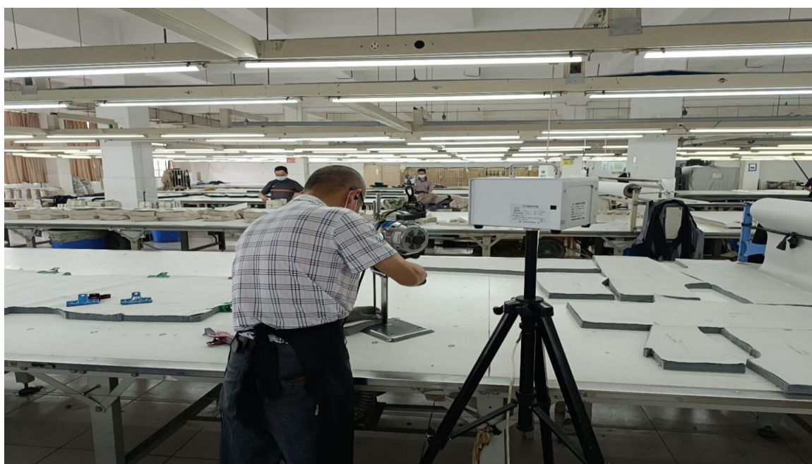
裁剪车间裁剪岗位