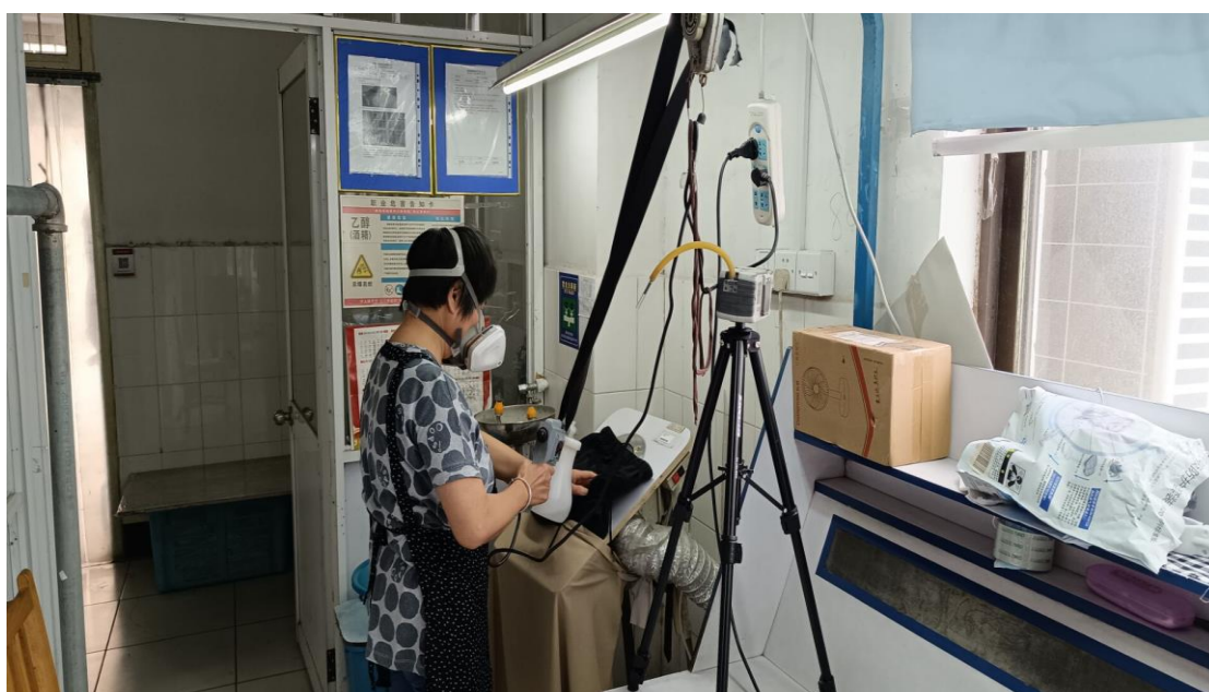
包装车间去污岗位