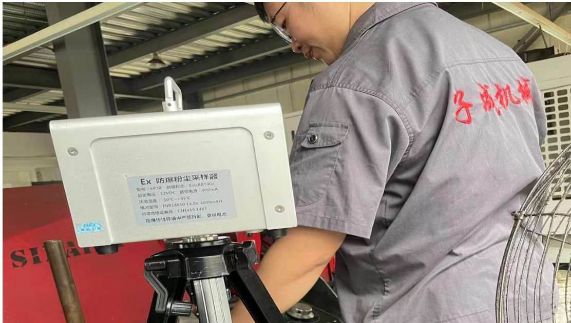
1F 生产车间锯床岗位