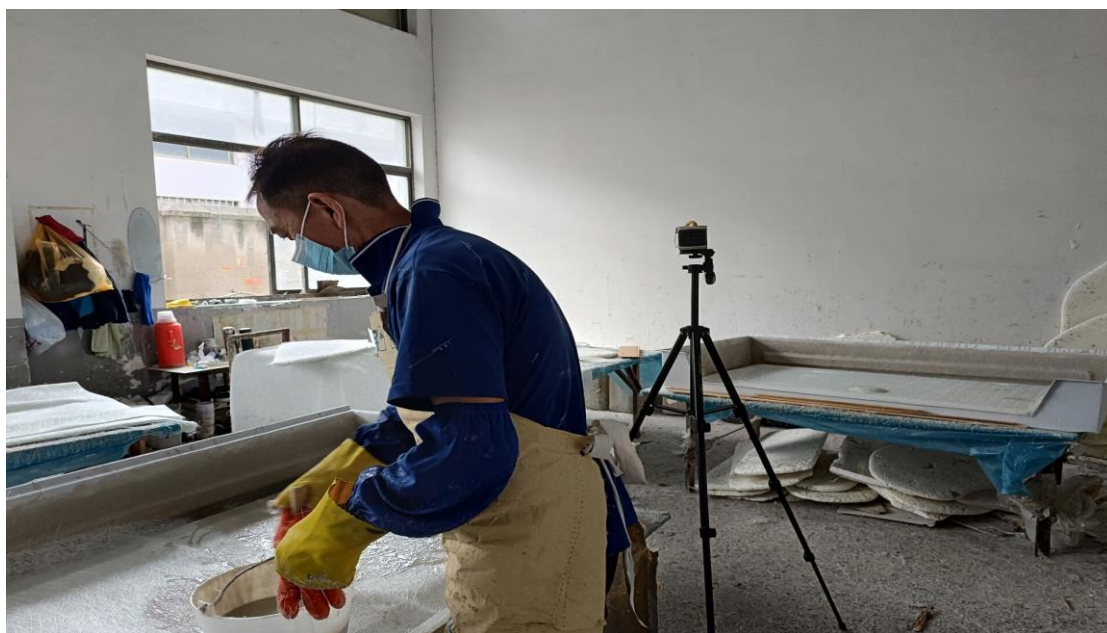
生产车间上纤维网刷胶岗位