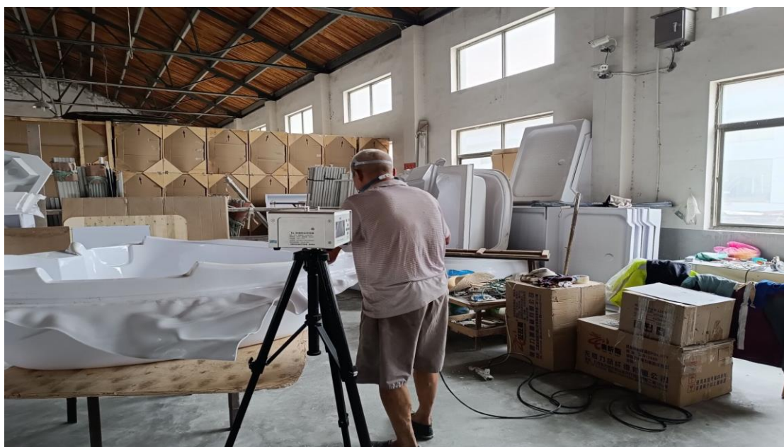
生产车间切割岗位