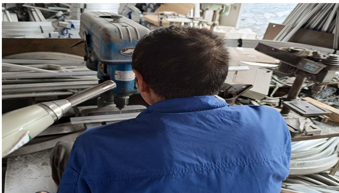
生产车间钻孔岗位