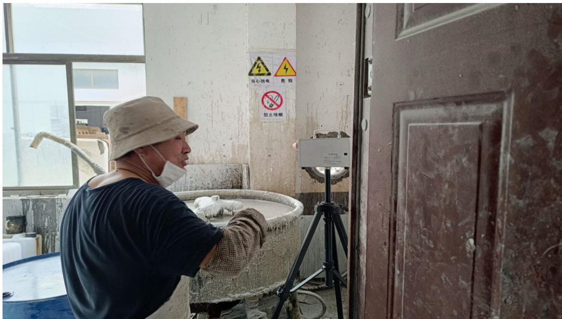
生产车间混料岗位