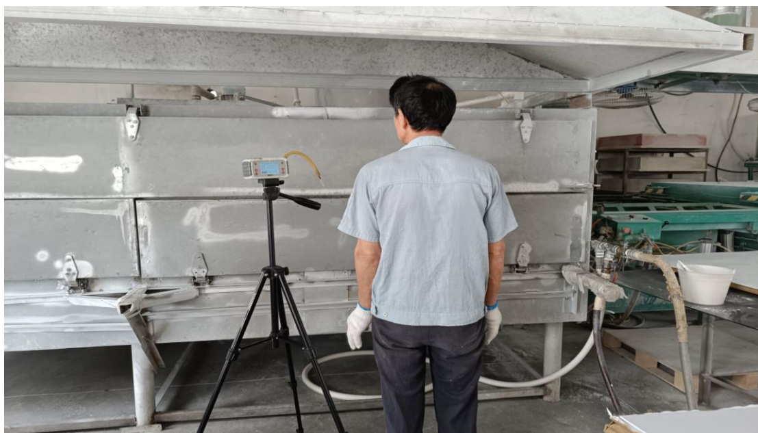
生产车间成型岗位