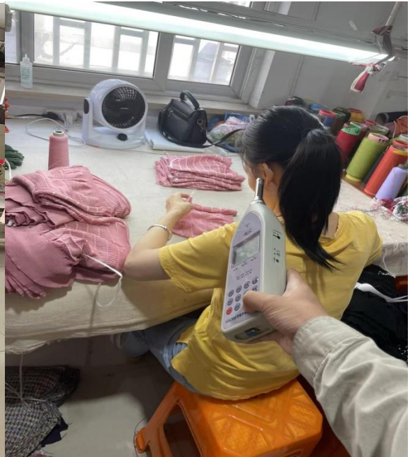
二楼生产车间检验岗位