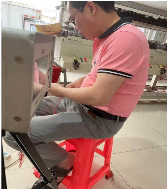
一楼生产车间倒毛岗位