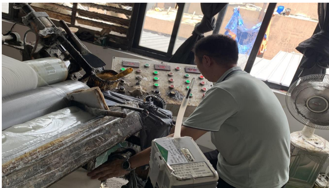
生产车间复合岗位