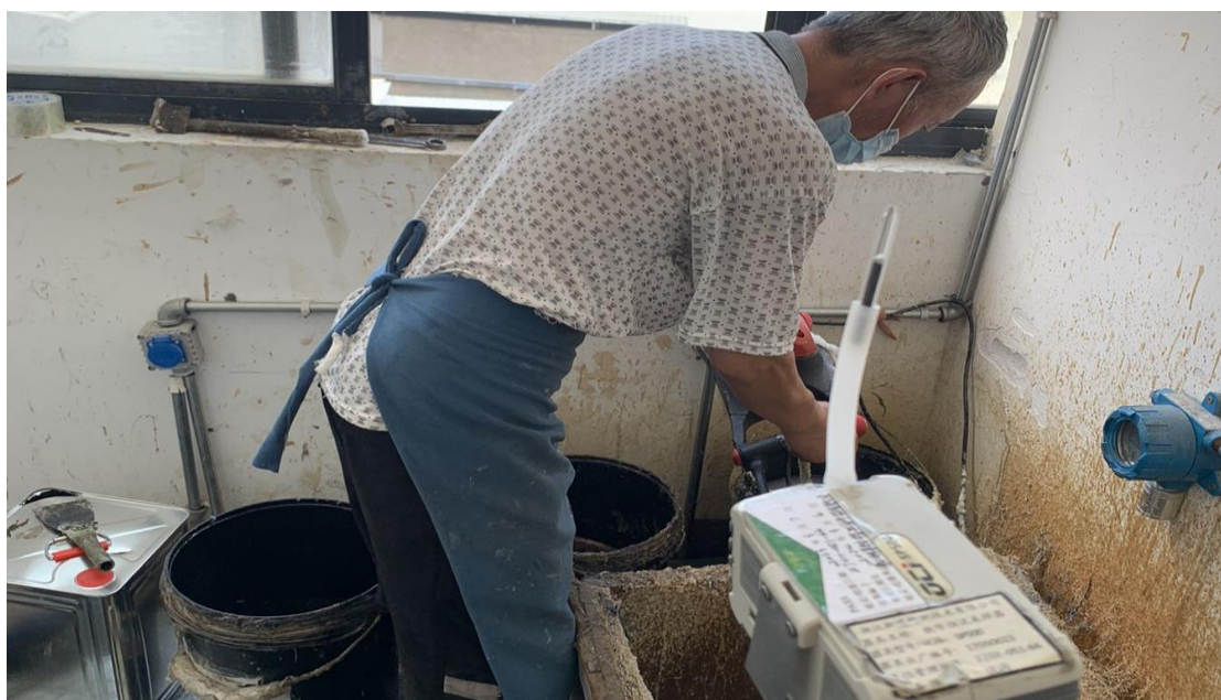
生产车间打浆岗位