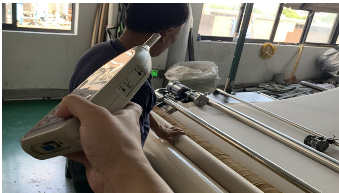
生产车间打卷岗位