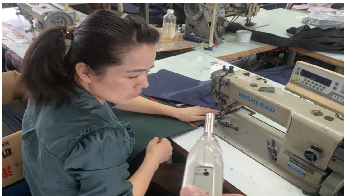
四楼车间缝纫岗位