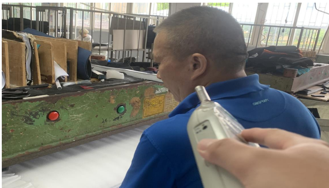
一楼车间冲压岗位