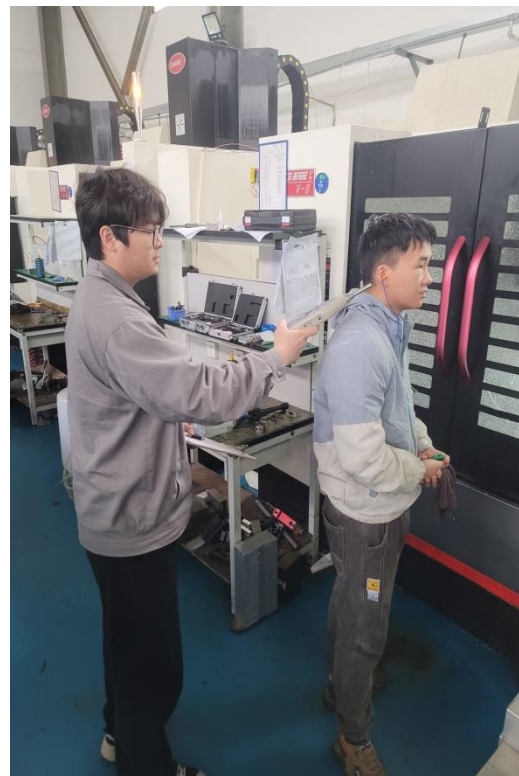
生产车间加工中心岗位