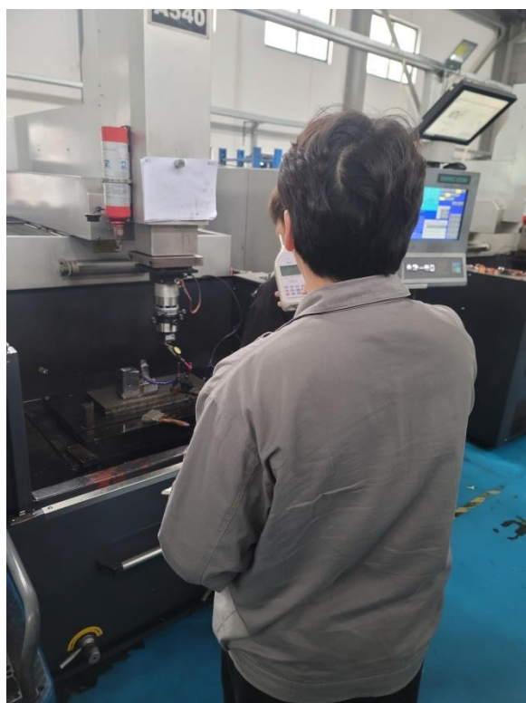
生产车间放电岗位