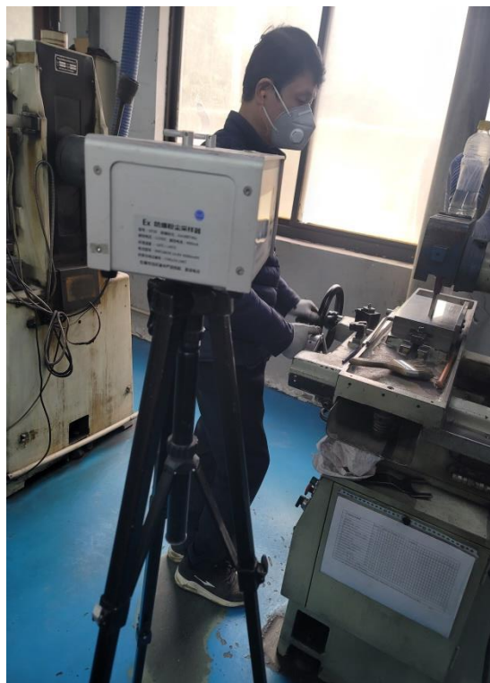
生产车间磨床岗位