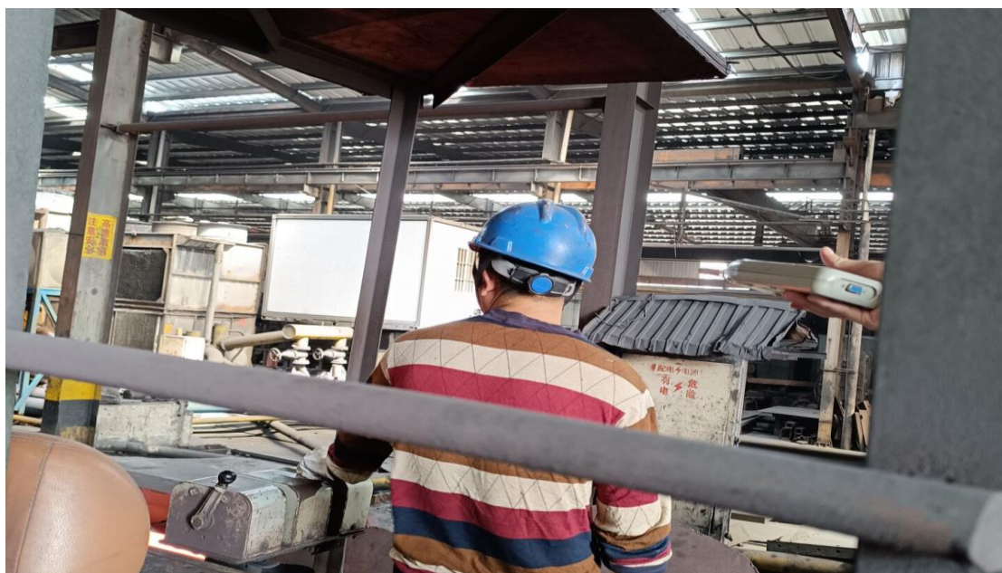
生产车间中轧岗位