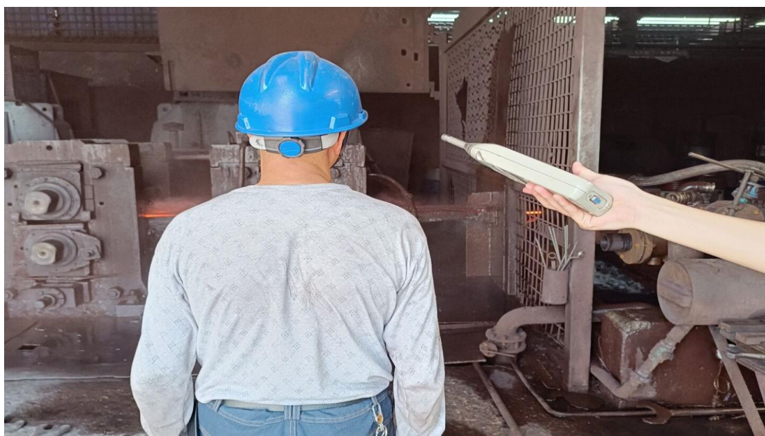
生产车间精轧岗位