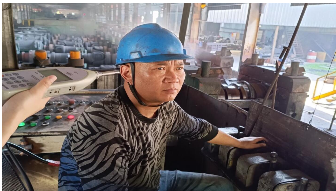
生产车间粗轧岗位