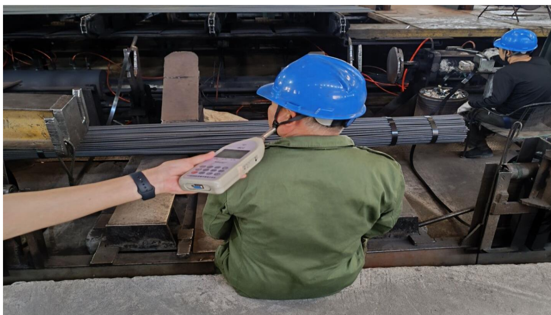
生产车间包装岗位