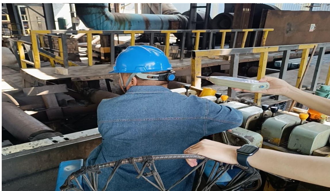
生产车间上料岗位