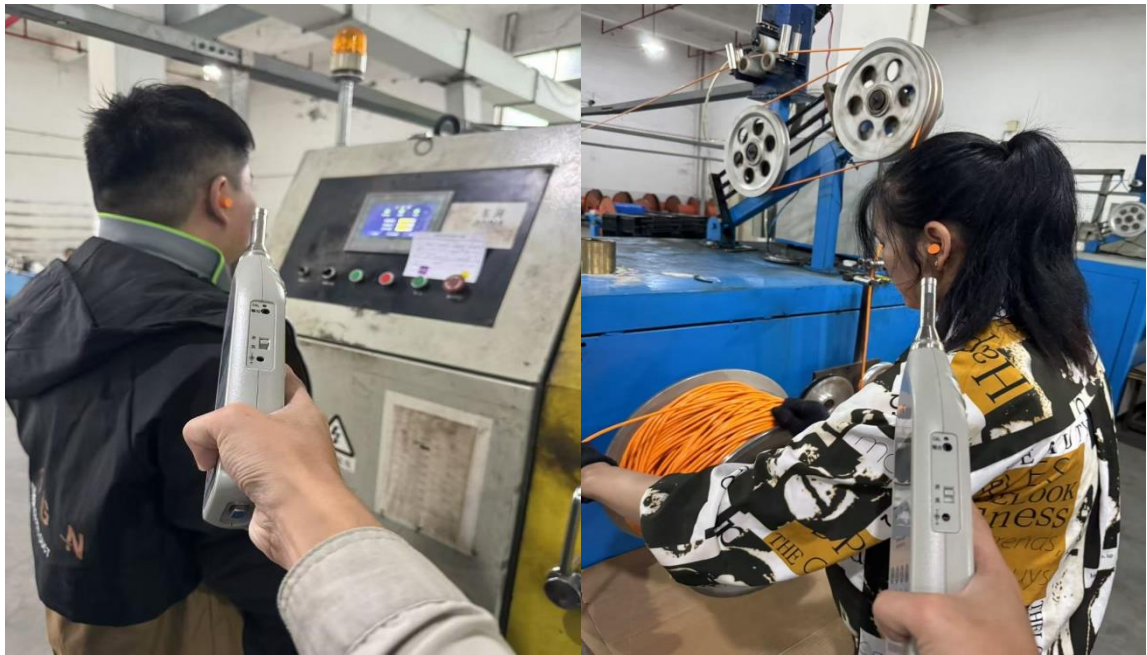
生产车间 1 成缆岗位