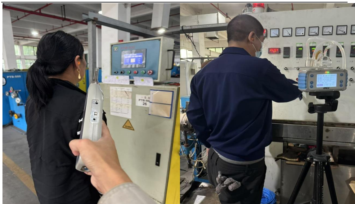
生产车间 1 对绞岗位