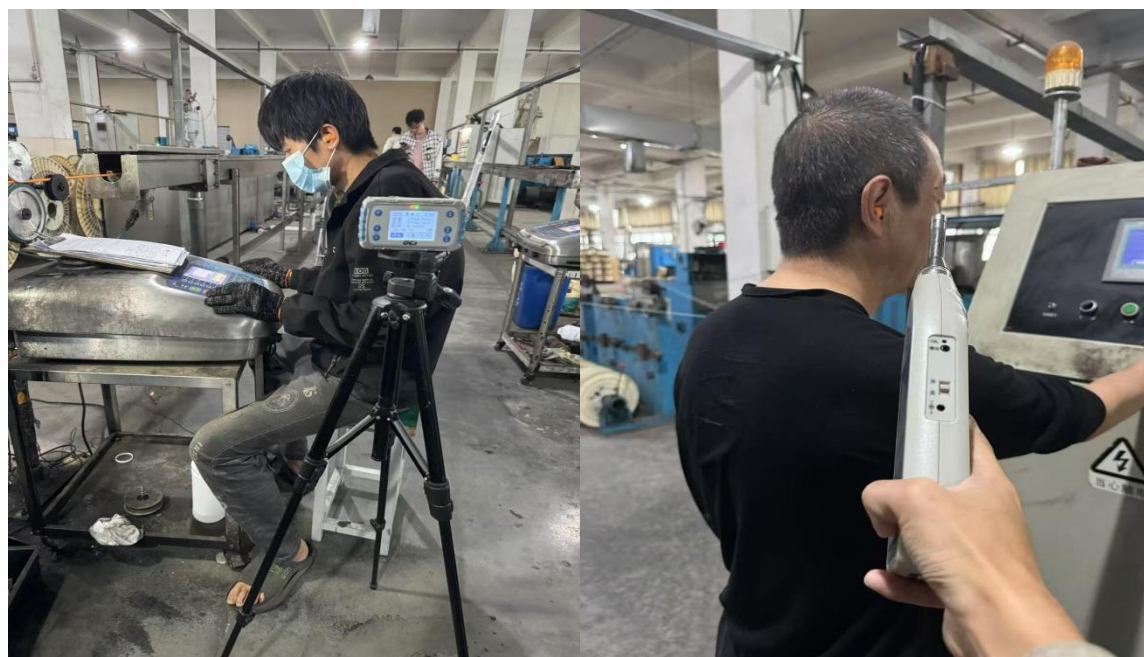
生产车间 2 喷码岗位