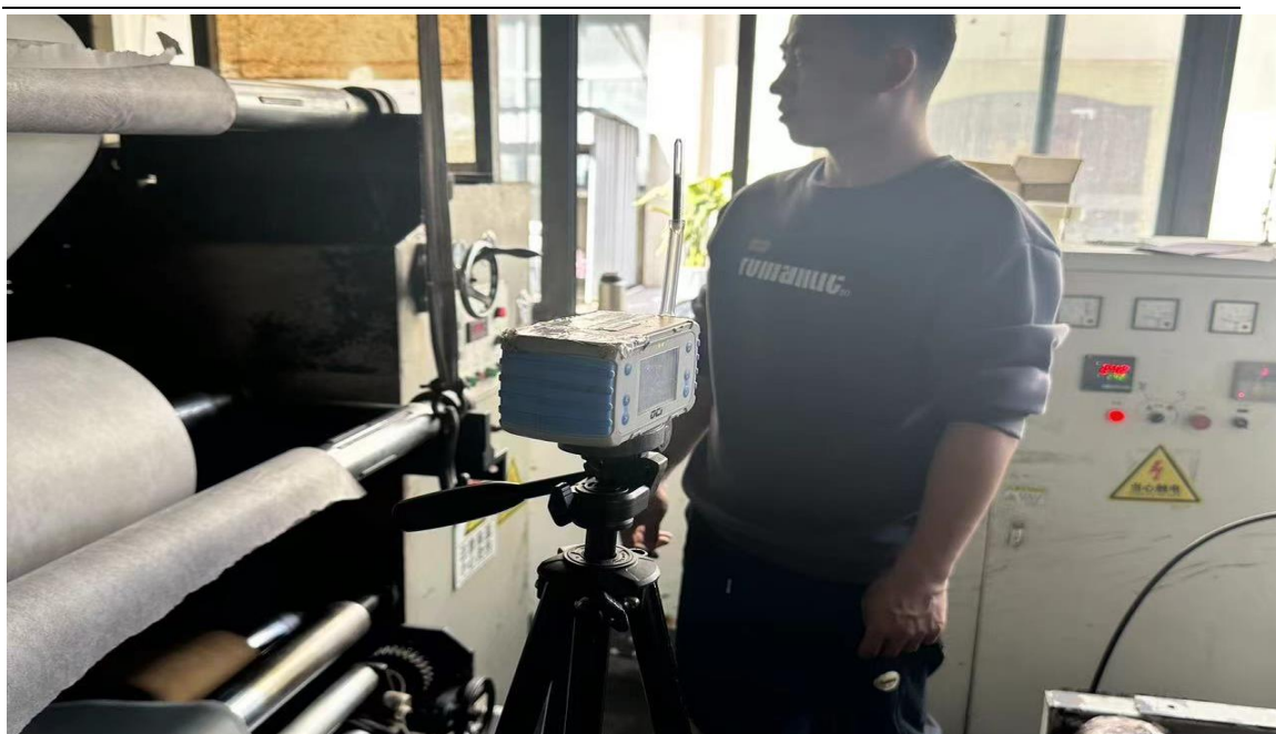
生产车间 1F 印布岗位