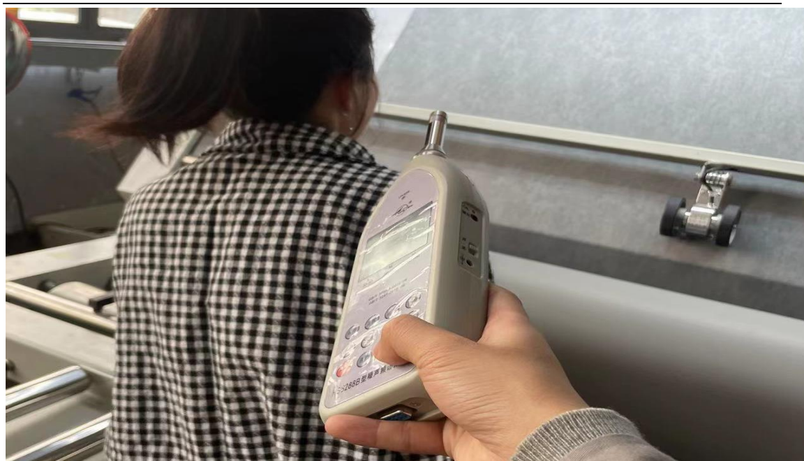
生产车间 1F 打卷岗位