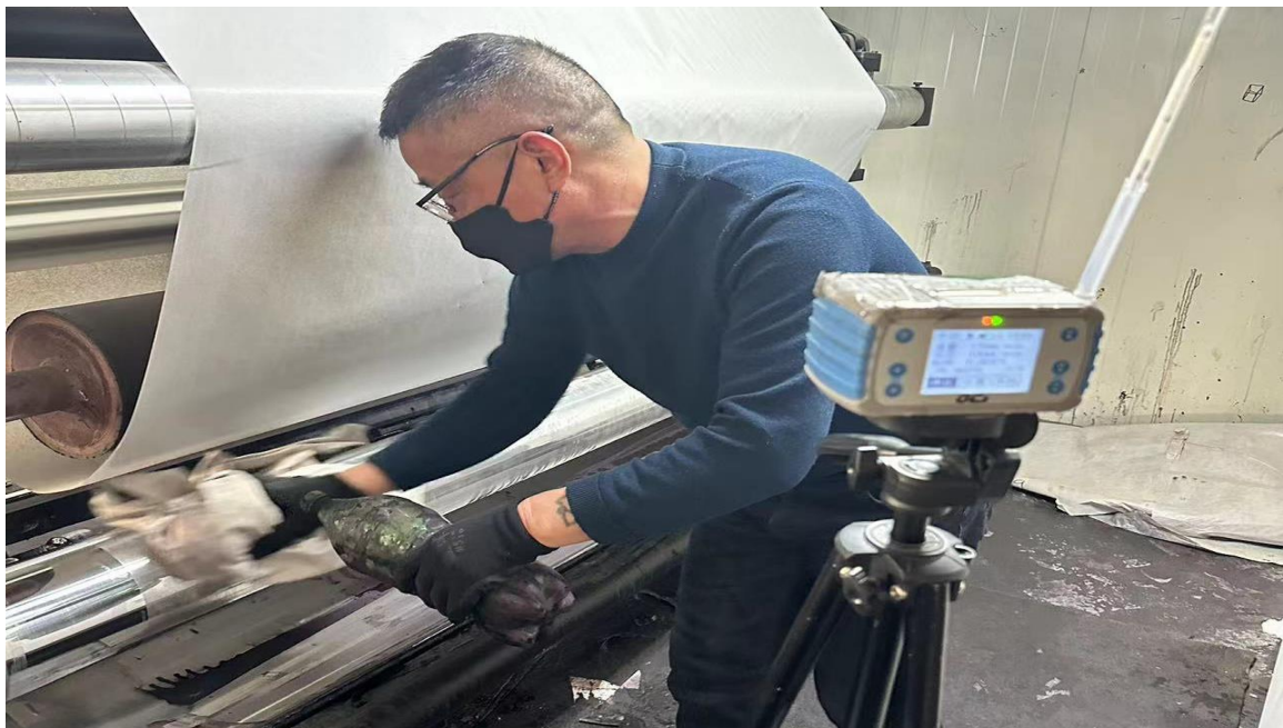
生产车间 1F 清洗岗位