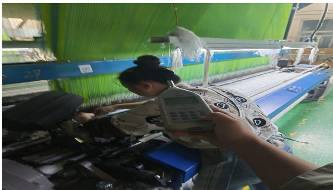
织造车间剑杆织机岗位