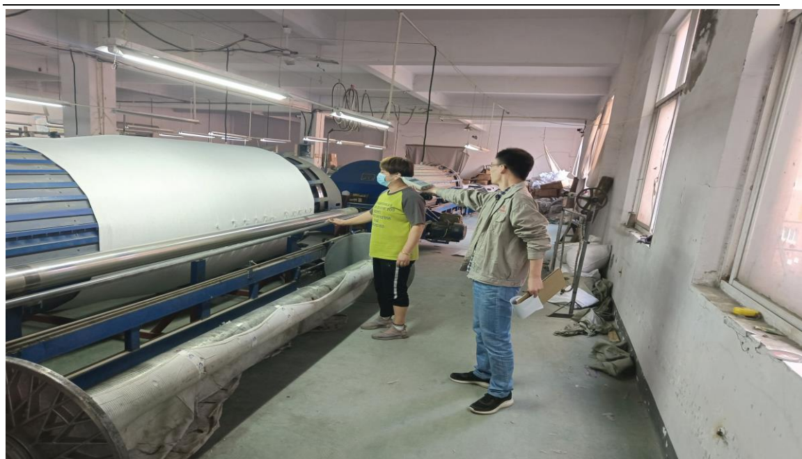
整经车间整经岗位