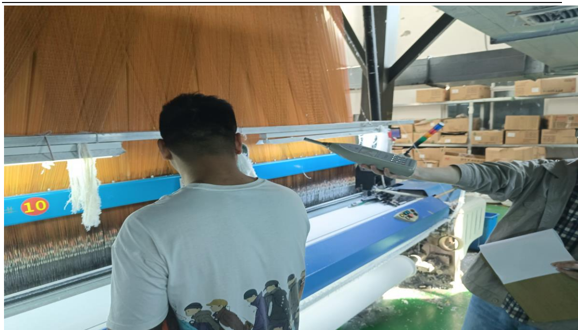
织造车间喷气织机岗位