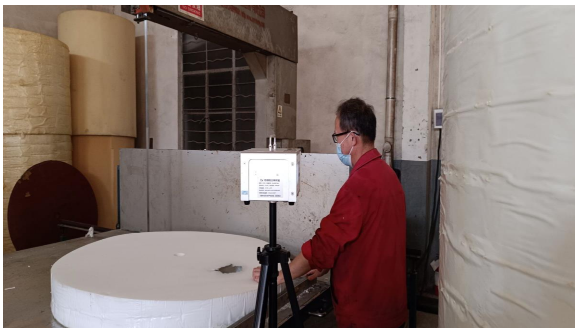
生产车间分切岗位