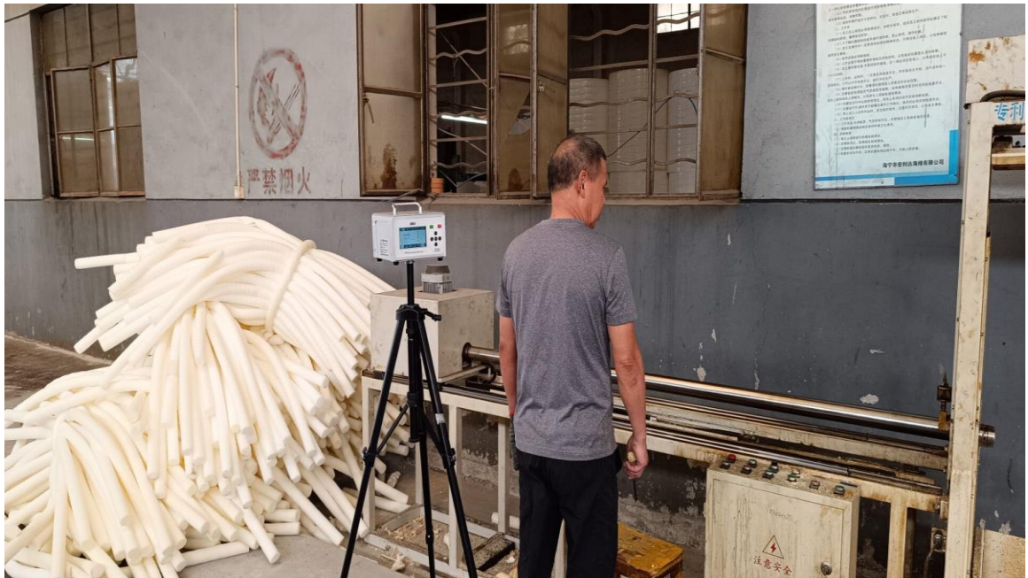
生产车间打孔岗位