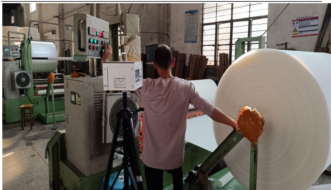
生产车间平切岗位