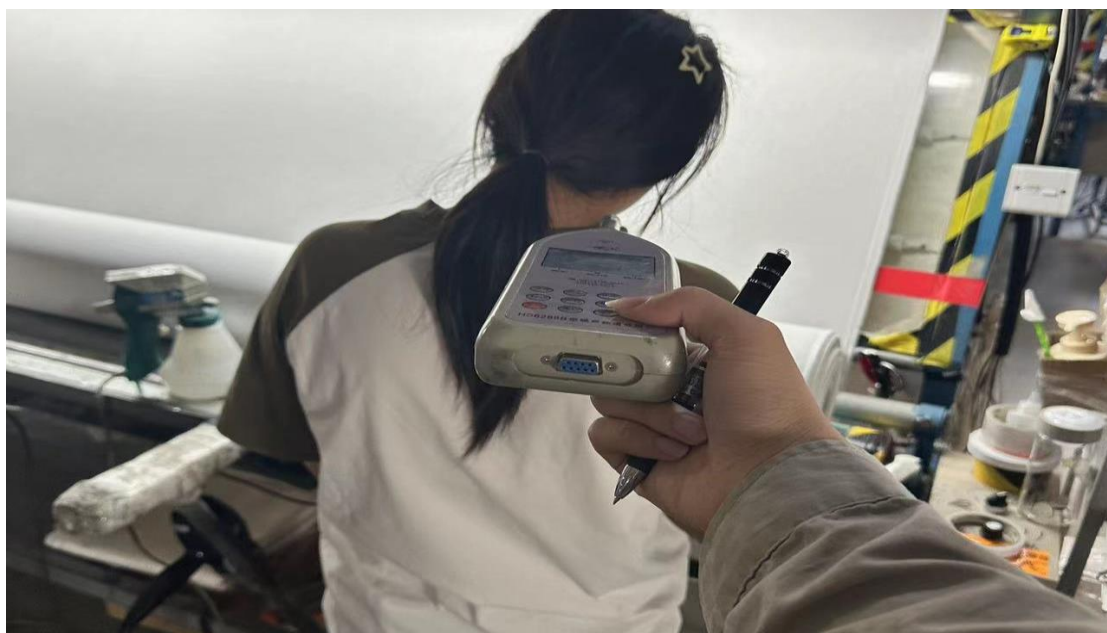
5F 打卷车间打卷机岗位