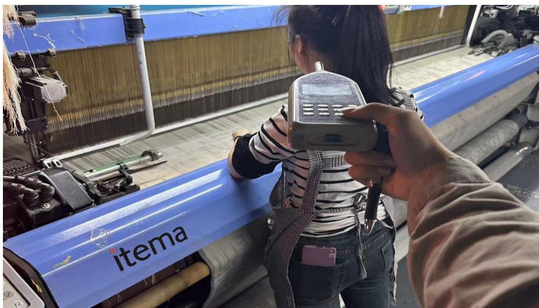
剑杆车间剑杆机岗位