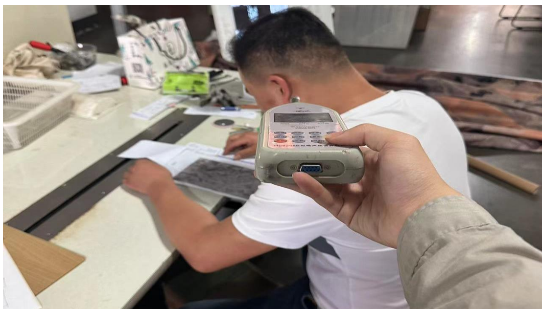
绣花车间绣花机岗位