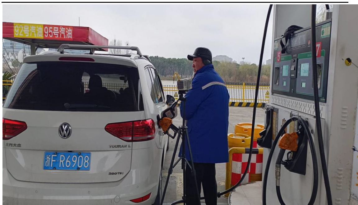
加油单元加油岗位