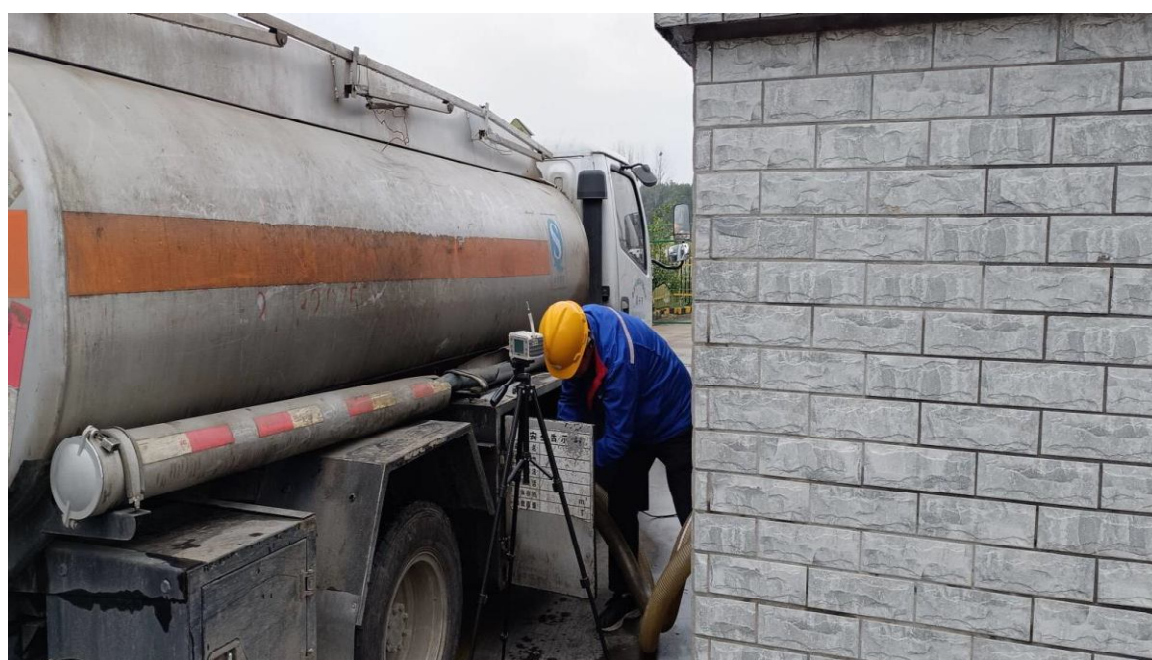
卸油单元卸油岗位