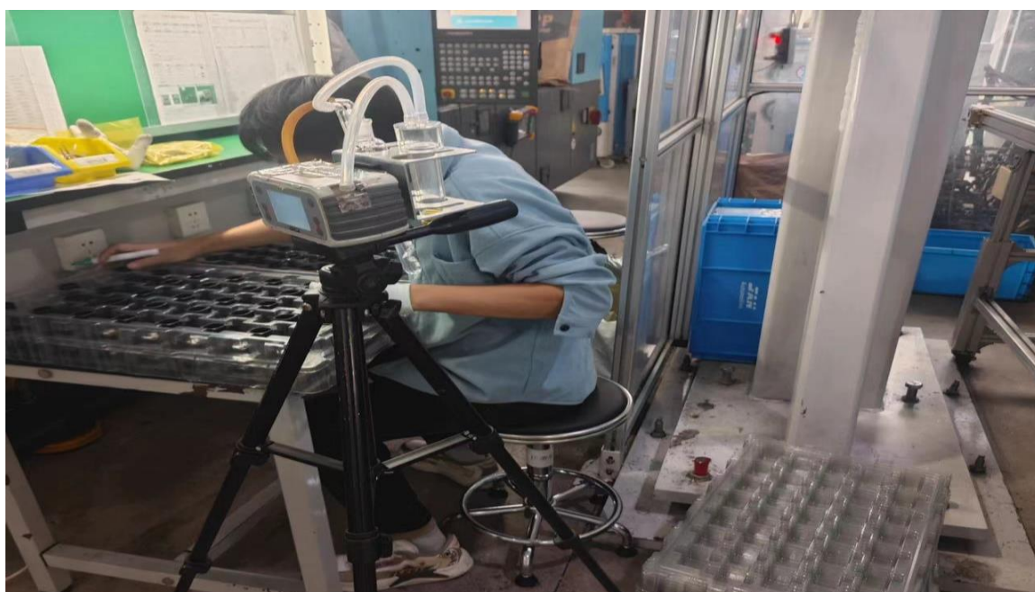
注塑车间注塑岗位