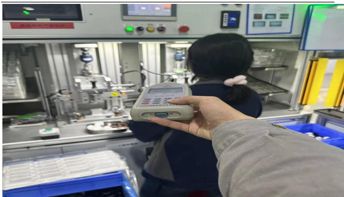
组装车间组装岗位