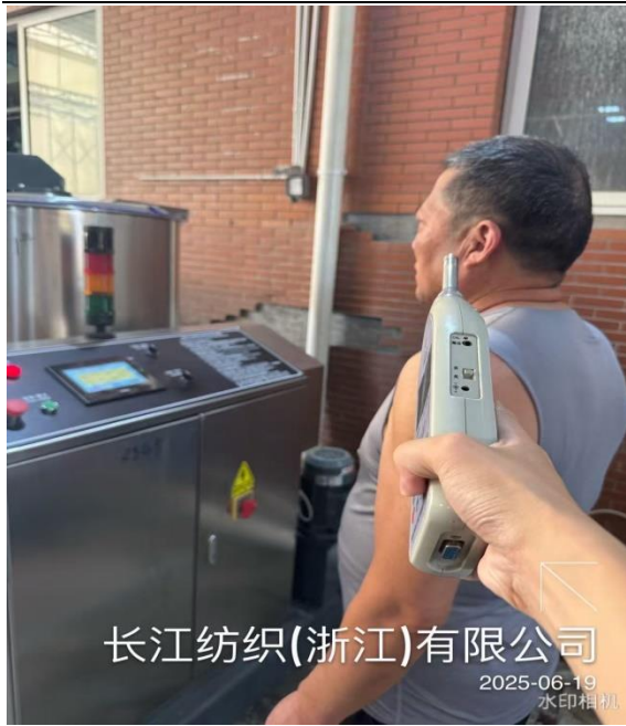
染色车间脱水岗位