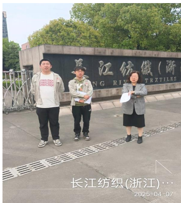
现场调查企业门口留影