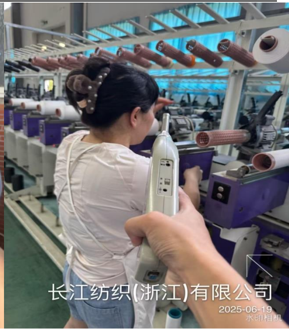
前纺车间松筒岗位