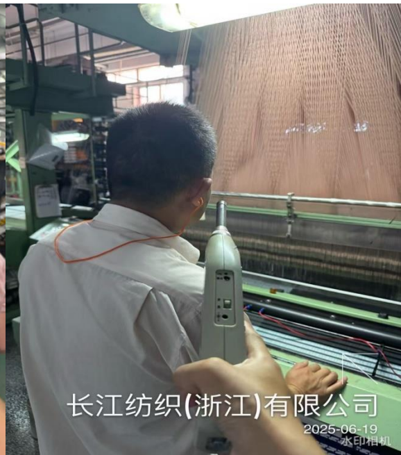
商标车间 1F 织机岗位