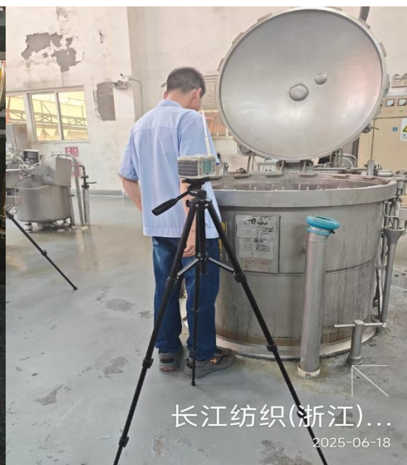
染色车间染色岗位