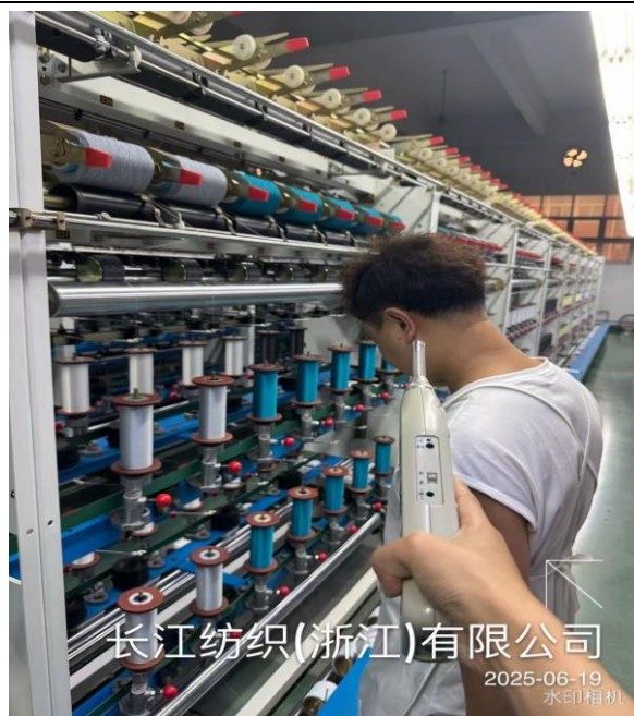
包覆纱车间 1F 包纱岗位