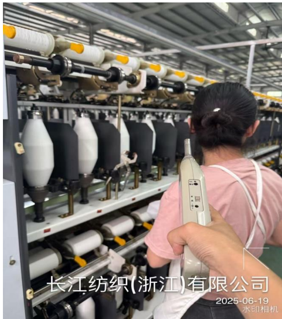
前纺车间倍捻岗位