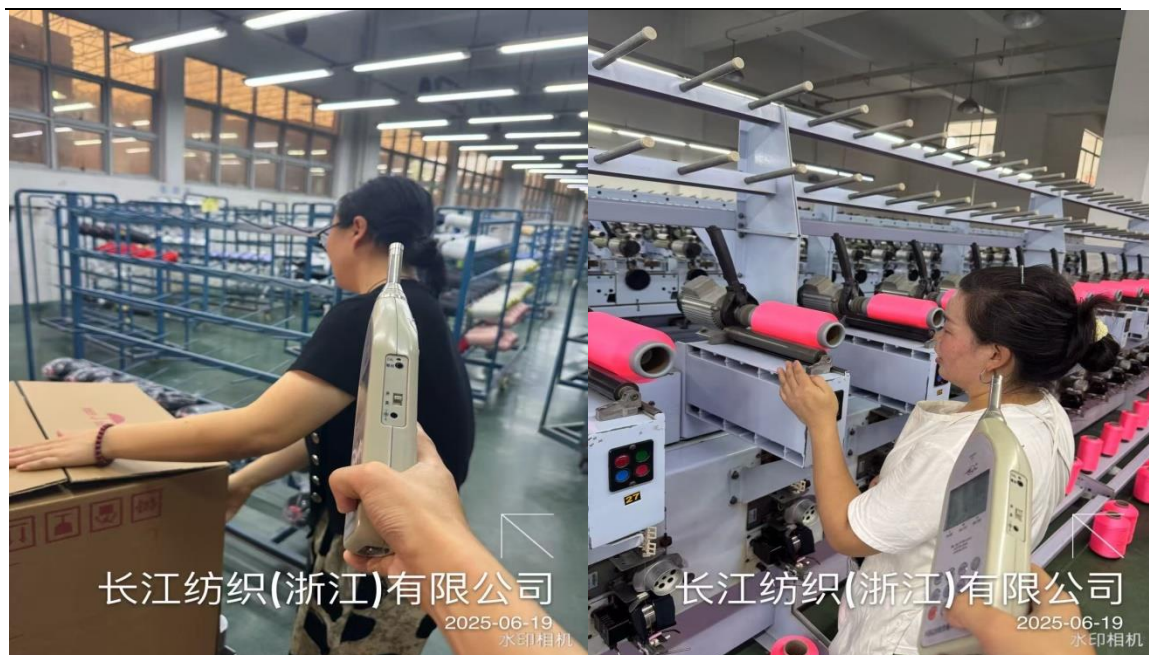
紧筒车间包装岗位