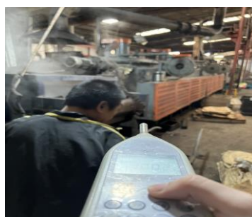
生产车间收料岗位