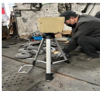
生产车间打磨岗位