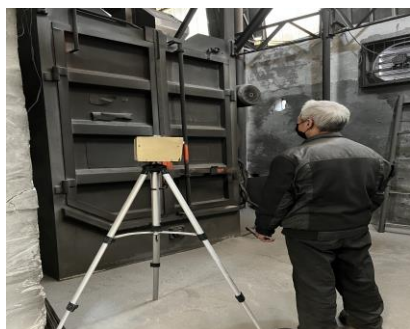
生产车间抛丸岗位